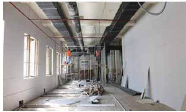
სარეაბილიტაციო სამუშაოები თსუ II კორპუსში