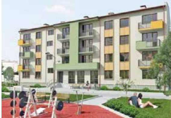
თსუ საერთო საცხოვრებელი

საერთო საცხოვრებელი - „დიდი მალაღვი მინდა გადაუხადო საკითხველს მთავრობის იმისთვის, რომ ახალი საერთო საცხოვრებელი გადმოეცა თსუ-ს. ეს გახლავთ თანამედროვე სტანდარტების, 320 ადგილზე გათვლილი საერთო საცხოვრებელი, სადაც განთავსებულია ადმინისტრაციული და 3 ოთხსართულიანი საცხოვრებელი კორპუსი, სპორტული ბლოკი და მოედნით. ეს ყველაფერი მოგვემსახურება, რომ სტუდენტური ცხოვრება ამ მიმართულებით გაუმჯობესდეს. გაჩერება არ ვაპირებთ და უახლოეს მომავალში ვეპარულობთ, რომ გამოცხადდება გენდერი, სადაც ჩვენ როგორც უნივერსიტეტი, ასევე საკითხველს მთავრობა, ერთობლივად გამოცხადდეს გენდერს ამ კომპანიის ინტერესის გამოსახედად, ვინც თანახმა იქნება, რომ ააშენოს მასშტაბური საერთო საცხოვრებელი. რაც, საბოლოოდ, გადაწყვეტს სტუდენტური ადგილების პრობლემას საერთო საცხოვრებელში თსუ-სთვის და არამხოლოდ, ეს პროექტი შესაძლოა იყოს სხვა უნივერსიტეტებისთვისაც.“